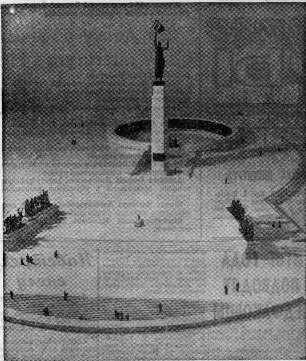
Общий вид памятника, который будет установлен на площади Победы в Ленинграде.