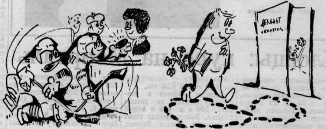
Выполняя задание группы

(Окончание. Начало на 1-й стр.) маме хоккея с шайбой. В результате у наблюдавших игру сложилось о ней превратное представление, а наша пресса после этих матчей писала следующее: «Игра носит сугубо индивидуальный и примитивный характер, весьма бедна комбинациями».