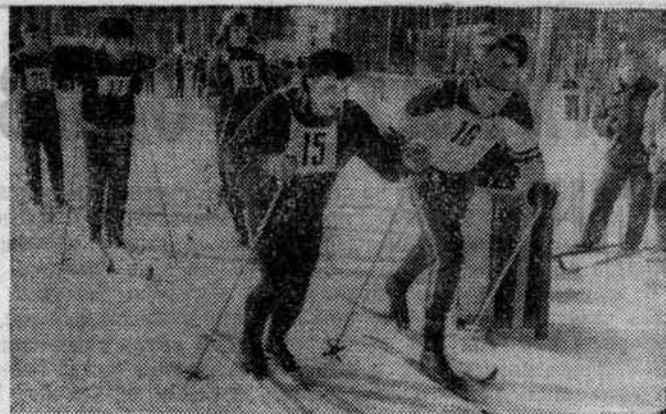
ИНСТИТУТСКАЯ спартакиада здоровья пользуется большой популярностью у сотрудников вуза. Более 150 человек приняли участие в лыжных стартах спартакиады. НА СНИМКЕ: на старте соревнований спартакиады.

№ 18 (860) | Понедельник, 10 мая 1976 г. | Газета издается с 1940 года | Цена 1 коп.