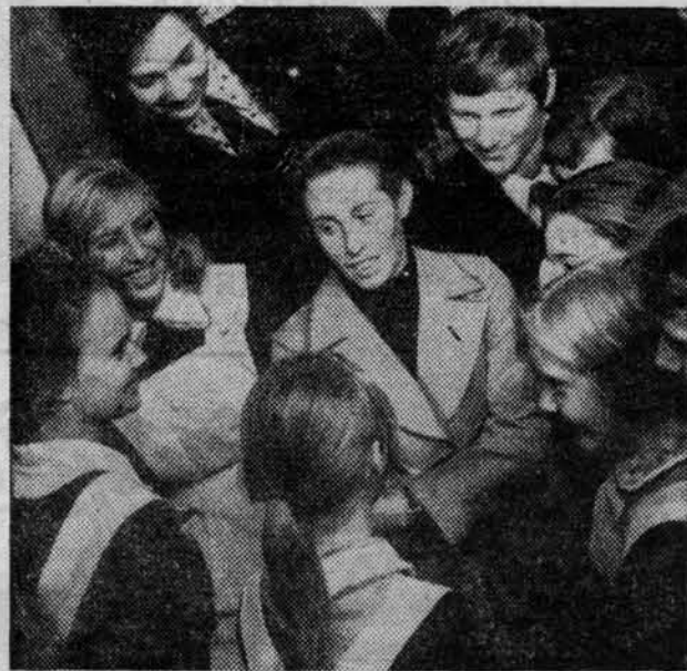
Олимпийская чемпионка аспирантка Татьяна Казанкина (в центре) в гостях у школьников Октябрьского района.