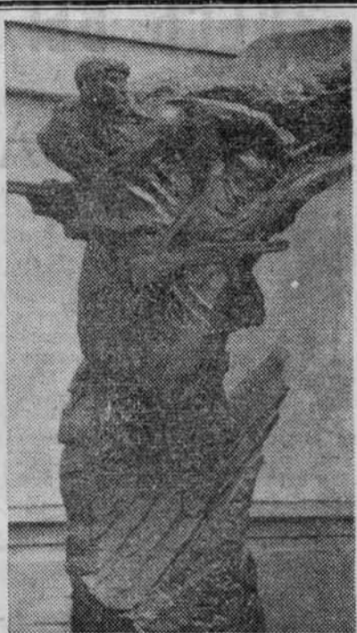
СКУЛЬПТУРНАЯ группа, посвященная героическим воинам-лесгафтовцам. Установлена во дворе института.