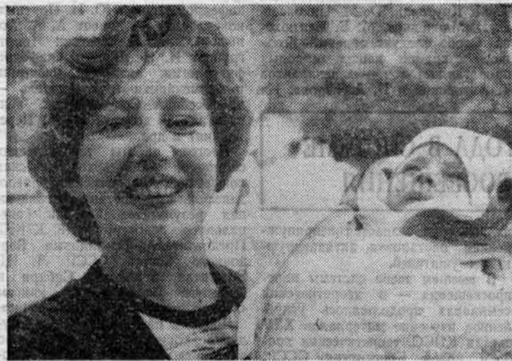
«МАТЕРИНСКОЕ СЧАСТЬЕ»