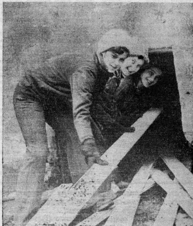
Педфаковцы на субботнике. «Работаем по-ударному!».

Среди лыжниц гонку выиграла обладательница Кубка мира Г. Кулакова. Дистанцию в 7,5 км она прошла за 18 мин. 02 сек. Олимпийская чемпионка Р. Сметанина уступила ей всего 18 секунд.