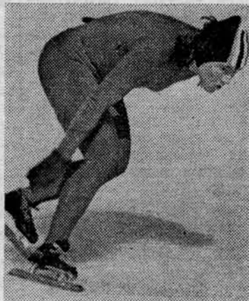
Галина Степановская, чемпионка XII зимних Олимпийских игр по конькобежному спорту.