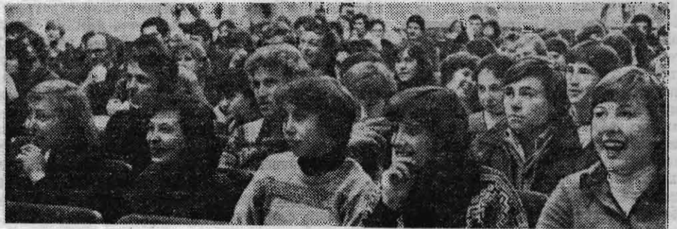
На снимках: на курсе веселых и находчивых, в зале и на сцене.