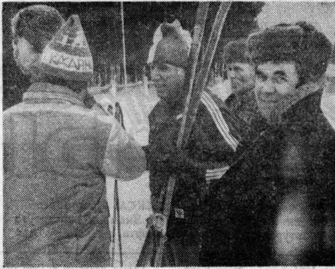
АКТИВНЕЙШИМИ участниками институтских дней здоровья являются наши ветераны. Вышли они на старт лыжных гонок этого спортивного праздника и в прошлую пятницу. На снимке: группа лесгафтовцев-ветеранов на дне здоровья в Кавголово.