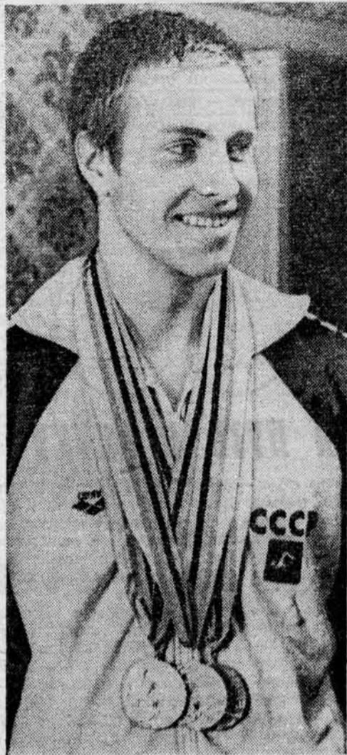
Владимир Сальников, трижды чемпион Олимпиады-80 и рекордсмен мира по плаванию.