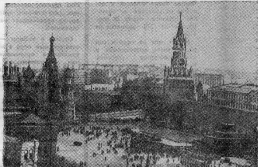
МОСКВА — СТОЛИЦА СССР.

тенденции повышения уровня в предостережения. По по труду ми темп рост по Обшая