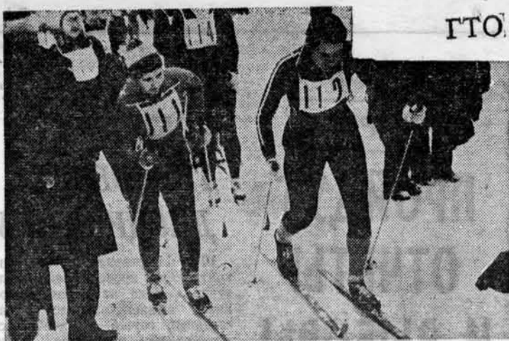
В дни, предшествующие Всесоюзному дню лыжника, лесгафтовцы сдавали нормы ГТО. На снимках: студенты на лыжне ГТО.