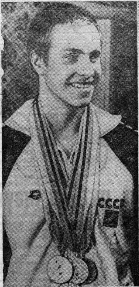
Аспирантом института является окончивший его в прошлом году чемпионом XXII Олимпийских игр, рекордсмен мира по плаванию Владимир Сальников.

На снимке: Владимир Сальников.