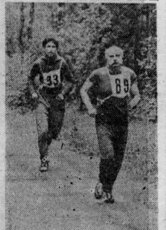
На снимках: лесгафтовцы на дистанциях Всесоюзного дня бегуна в Кавголово.