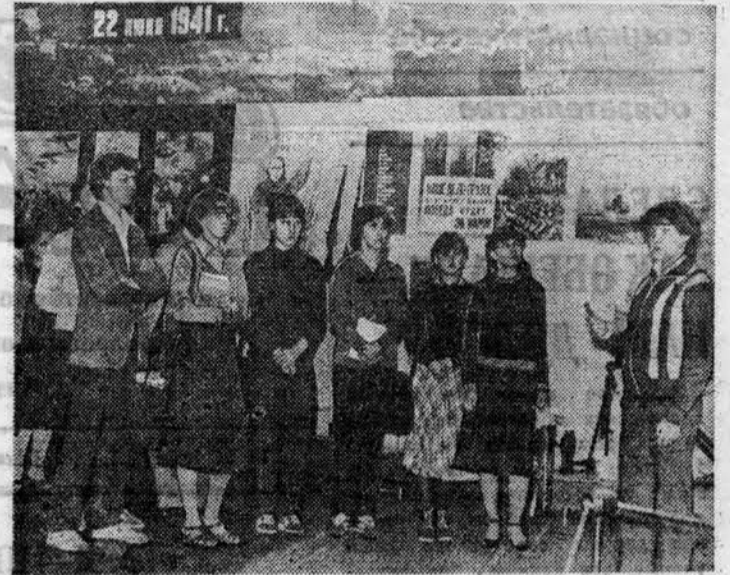
Студенты — слушатели отделения экскурсоводов ФОП на занятии у экспозиции Музея артиллерии.