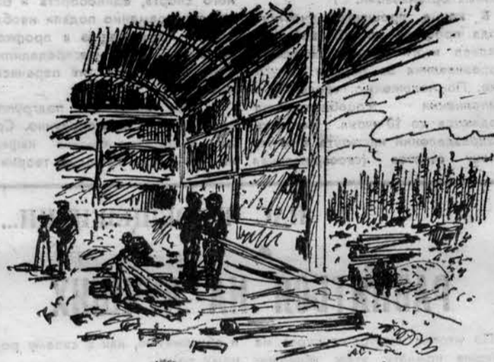
Ноябрьск. Лето 1985 г.

В этот праздник ребята раскрылись по-новому. Кто бы мог подумать, например, что Володя Новоселов, наш самый серьез-