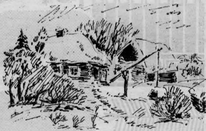
«В деревне Краснополицы Калининской области». «Один из шедевров русского зодчества, памятник российской истории — собор на р. Нерли Владимирской области». «Гор. Горький. Кремль».