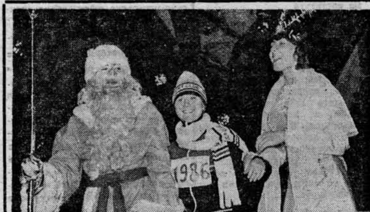
На новогоднем карнавале. (Репортаж о нем — на 2-й стр.).