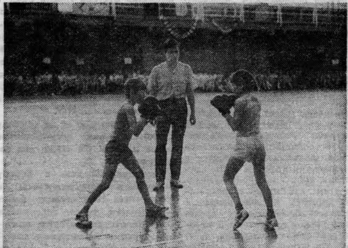
Редактор В. Ф. ТУРКИН