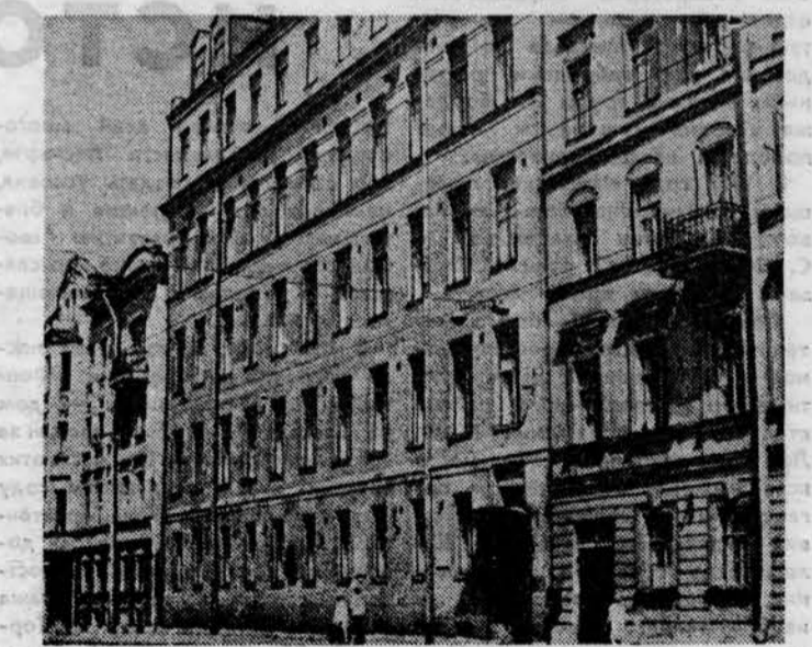
Дом № 32 по пр. Маклина (б. Английском пр.). Здесь помещались Курсы Лесгафта.