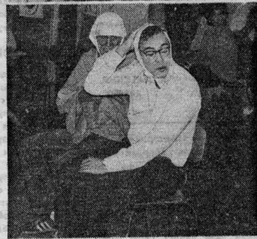
Студенческая агитбригада института выступила недавно перед первокурсниками, работавшими на уборке картофеля в совхозе «Гомонтово». На снимках: идет концерт агитбригады.