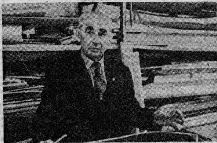
КОММУНИСТ НА СВОЕМ ПОСТУ — БОЕЦ!