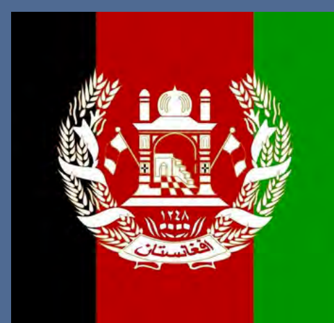
Хафизулла Вали РАХИМИ