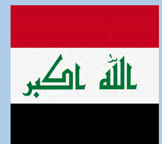
Али Джафар САМАКА