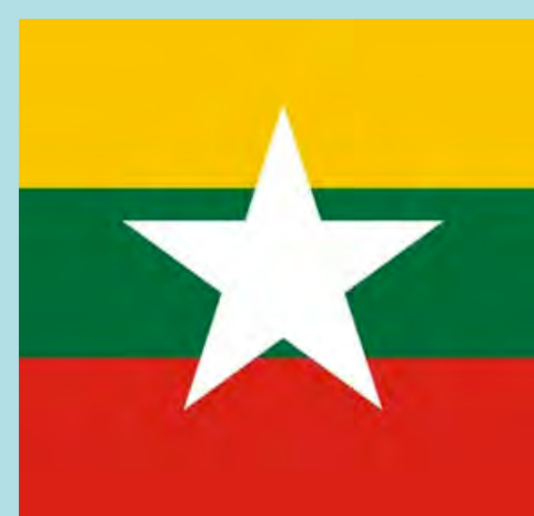
Мья ЛЭЙ СЭЙН