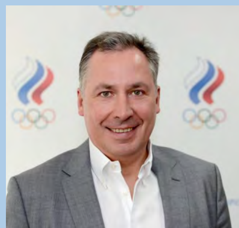
Станислав Алексеевич ПОЗДНЯКОВ