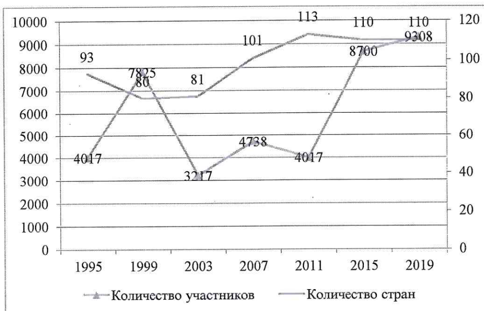
Рисунок 6 - Динамика проведения Всемирных летних военных игр.

Иллюстрируют ВКР, исходя из определенного общего замысла, по тщательно продуманным тематическим планам, помогает избежать иллюстраций случайных, связанных с второстепенными деталями текста, избежать неоправданных пропусков иллюстраций к важнейшим фактам. Каждая иллюстрация должна отвечать тексту, а текст - иллюстрации.