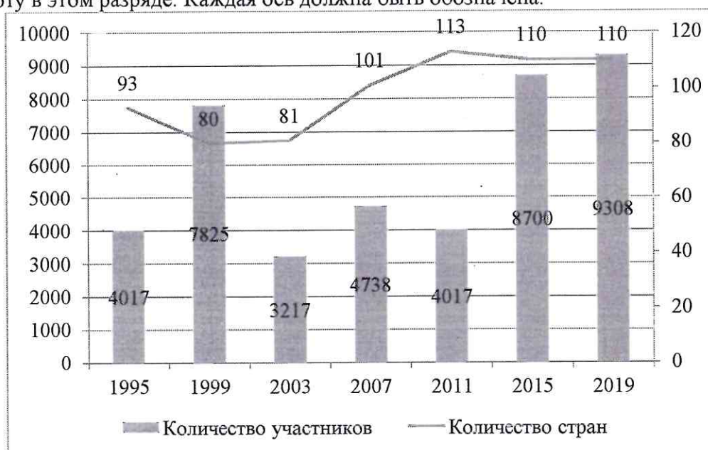
Рисунок 5 - Динамика проведения Всемирных летних военных игр

Столбиковая диаграмма (см. рисунок 5): это последовательность столбцов, каждый из которых опирается на один разрядный интервал, а высота его отражает число случаев или частоту в этом разряде. Каждая ось должна быть обозначена.