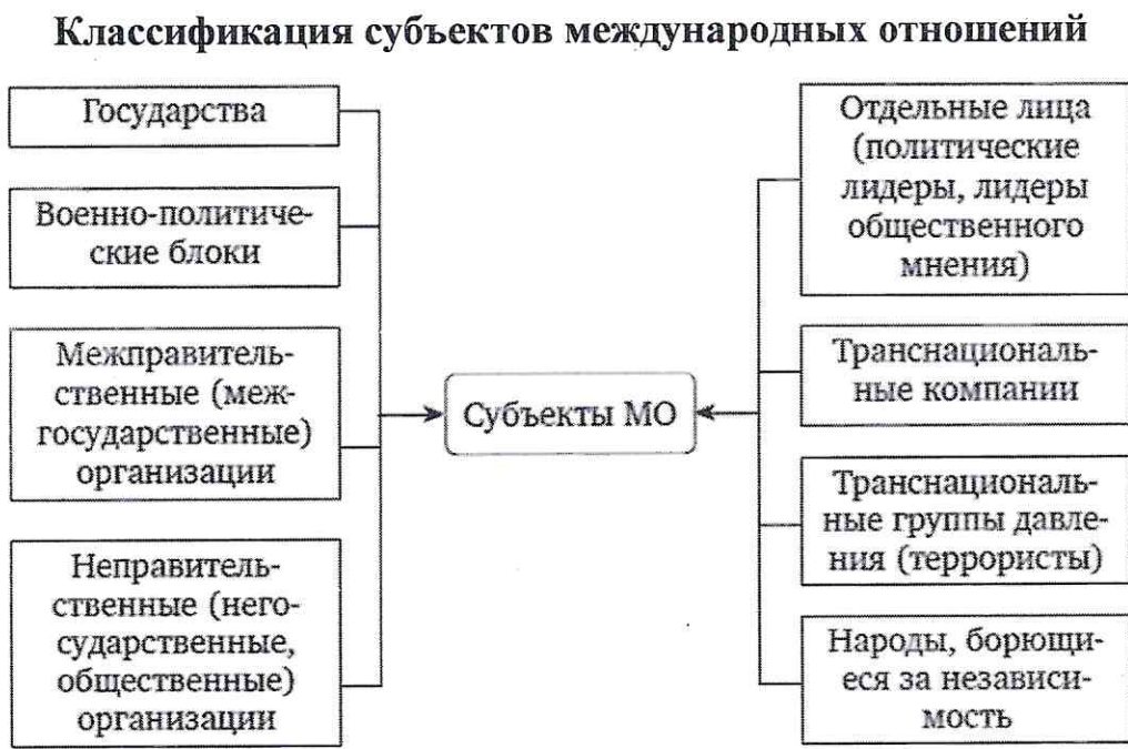
Рисунок 1 - Классификация субъектов международных отношений

Для иллюстрирования структуры явлений или процессов, взаимосвязей элементов системы, иерархии, классификационных признаков и т.п. в работе размещают схемы (см. рисунок 1).