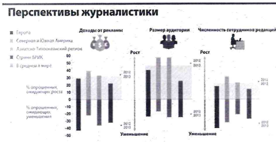
Рисунок 4 – Перспективы журналистики

Столбиковая диаграмма (см. рисунок 4): это последовательность столбцов, каждый из которых опирается на один разрядный интервал, а высота его отражает число случаев или частоту в этом разряде. Каждая ось должна быть обозначена.