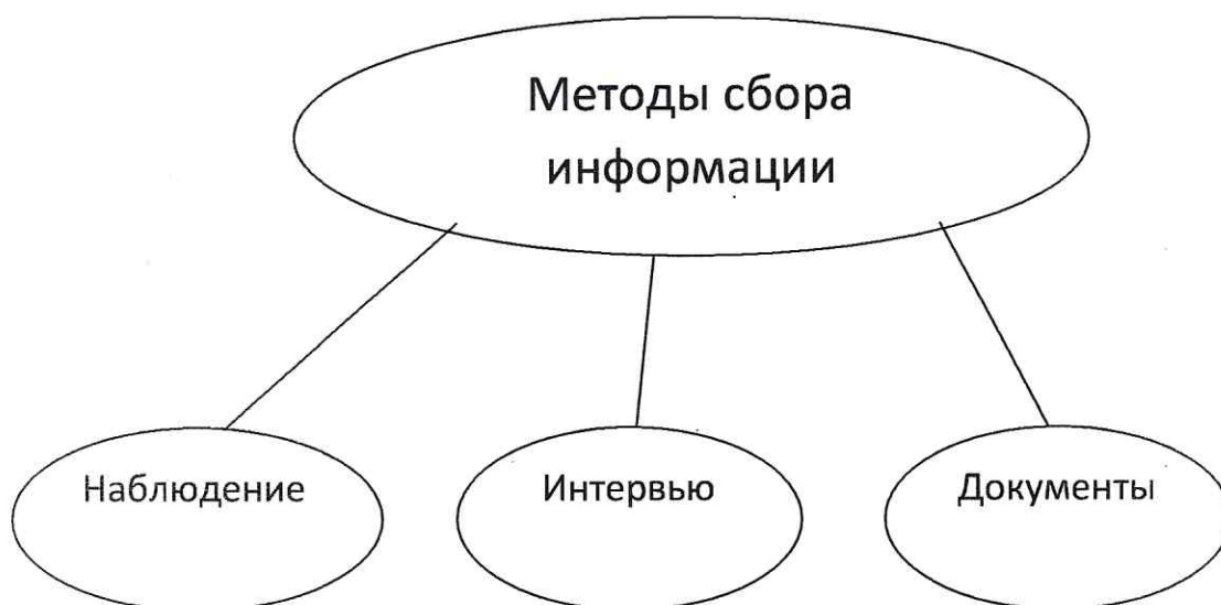
Рисунок 1 - Методы сбора информации

Для иллюстрирования структуры явлений или процессов, взаимосвязей элементов системы, иерархии, классификационных признаков и т.п. в работе размещают схемы (см. рисунок 1).