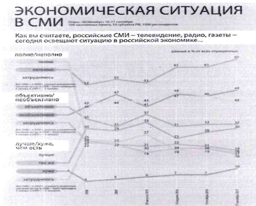
Рисунок 5 - Экономическая ситуация в СМИ

Для сравнения двух или нескольких рядов измерений можно построить график (см. рисунок 5)