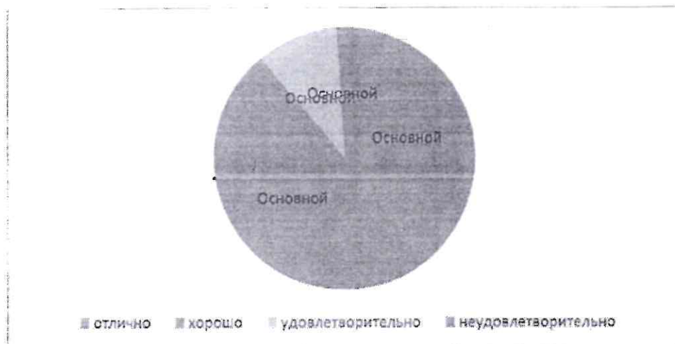
Рисунок 4 - Структура успеваемости школьников по физкультуре

Столбиковая диаграмма (рисунок 5): это последовательность столбцов, каждый из которых опирается на один разрядный интервал, а высота его отражает число случаев или частоту в этом разряде. Каждая ось должна быть обозначена.