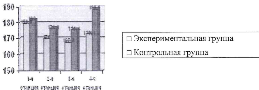
Рисунок 5 - ЧСС спортсменов во время тестирования на функциональную подготовку

Столбиковая диаграмма (рисунок 5): это последовательность столбцов, каждый из которых опирается на один разрядный интервал, а высота его отражает число случаев или частоту в этом разряде. Каждая ось должна быть обозначена.