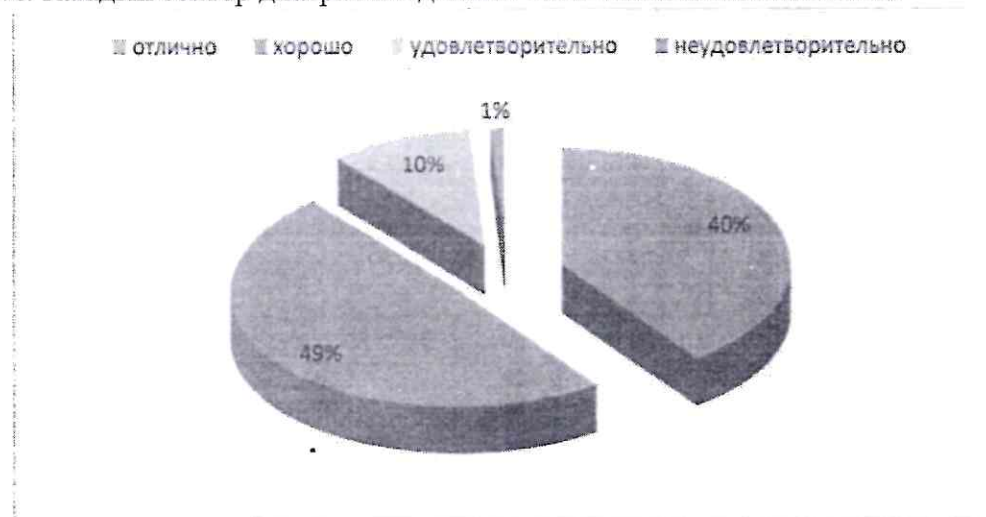
Рисунок 3 - Структура успеваемости школьников по физкультуре

Результаты исследований наиболее часто представляются в виде диаграмм и графиков. Диаграммы могут иметь вид столбцов или секторов. Секторная диаграмма (рисунок 3) и круговая диаграмма (рисунок 4) может быть использована в случаях, когда результаты представлены в процентном отношении. При этом площадь круга принимается за 100%. Каждый сектор диаграммы должен иметь название и значение.