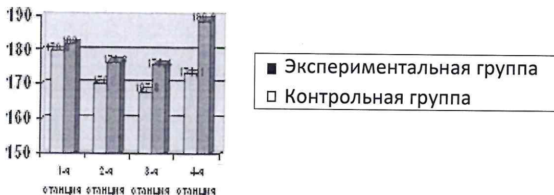
Рисунок 5 - ЧСС спортсменов во время тестирования на функциональную подготовку

Столбиковая диаграмма (рисунок 5): это последовательность столбцов, каждый из которых опирается на один разрядный интервал, а высота его отражает число случаев или частоту в этом разряде. Каждая ось должна быть обозначена.