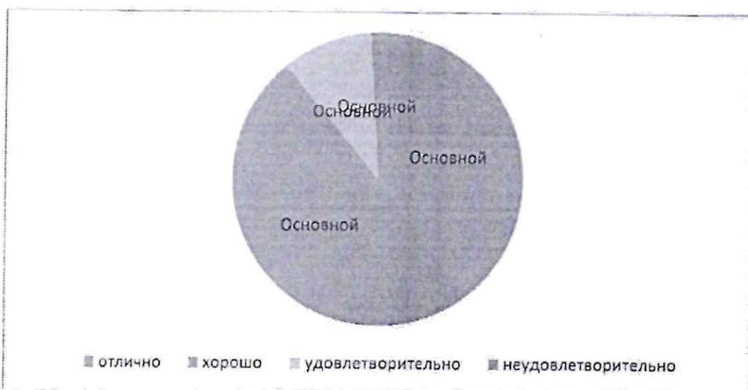
Рисунок 4 - Структура успеваемости школьников по физкультуре

Столбиковая диаграмма (рисунок 5): это последовательность столбцов, каждый из которых опирается на один разрядный интервал, а высота его отражает число случаев или частоту в этом разряде. Каждая ось должна быть обозначена.