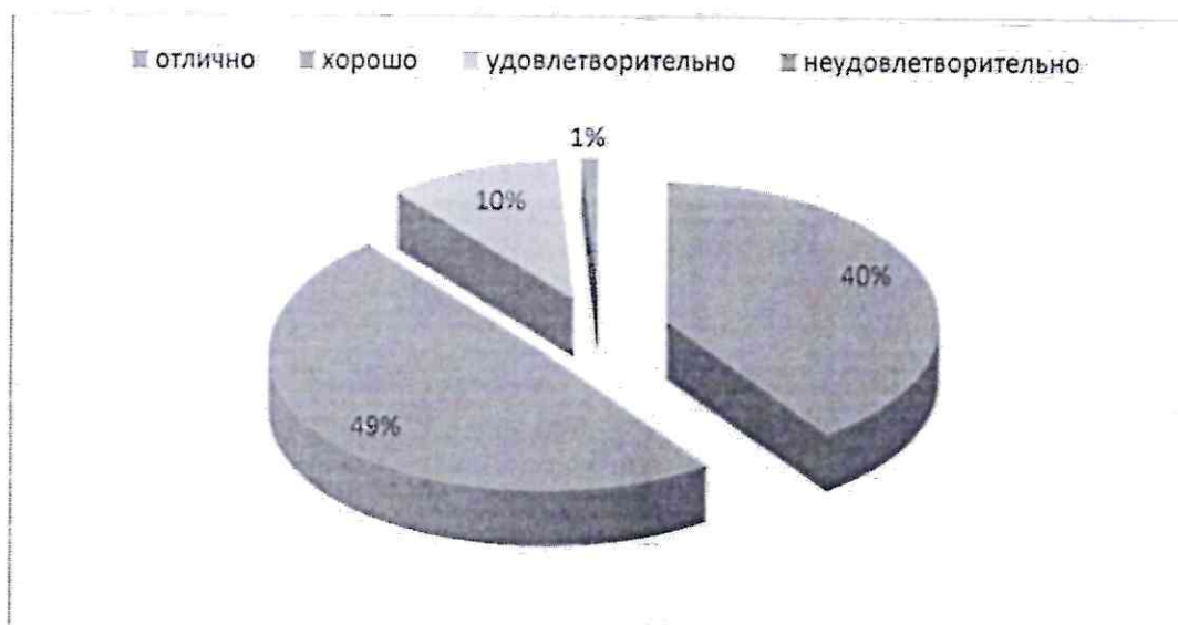
Рисунок 3 - Структура успеваемости школьников по физкультуре

Результаты исследований наиболее часто представляются в виде диаграмм и графиков. Диаграммы могут иметь вид столбцов или секторов. Секторная диаграмма (рисунок 3) и круговая диаграмма (рисунок 4) может быть использована в случаях, когда результаты представлены в процентном отношении. При этом площадь круга принимается за 100%. Каждый сектор диаграммы должен иметь название и значение.