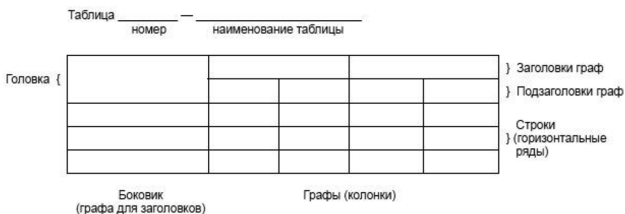
Рисунок 2 – Пример оформления таблицы

Таблицу с большим количеством строк допускается переносить на другую страницу. При переносе части таблицы на другую страницу слово «Таблица», её номер и наименование указывают один раз слева над первой частью таблицы, над другими частями слева пишется: «Продолжение таблицы» – и указывается номер таблицы. При делении таблицы на части допускается её головку или боковик заменять соответственно номерами граф и строк. При этом нумеруют арабскими цифрами графы и (или) строки первой части таблицы. Таблица оформляется в соответствии с рисунком 2.