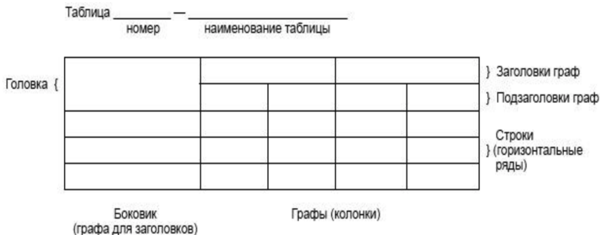
Рисунок 2 – Пример оформления таблицы

Таблицы, за исключением таблиц приложений, следует нумеровать арабскими цифрами сквозной нумерацией. Таблицы каждого приложения обозначаются отдельной нумерацией арабскими цифрами с добавлением перед цифрой обозначения приложения. Если в работе одна таблица, она должна быть обозначена «Таблица 1» или «Таблица А.1» (если она приведена в приложении А). Допускается нумеровать таблицы в пределах раздела при большом объёме данных. В этом случае номер таблицы состоит из номера раздела и порядкового номера таблицы, разделённых точкой: Таблица 2.3.