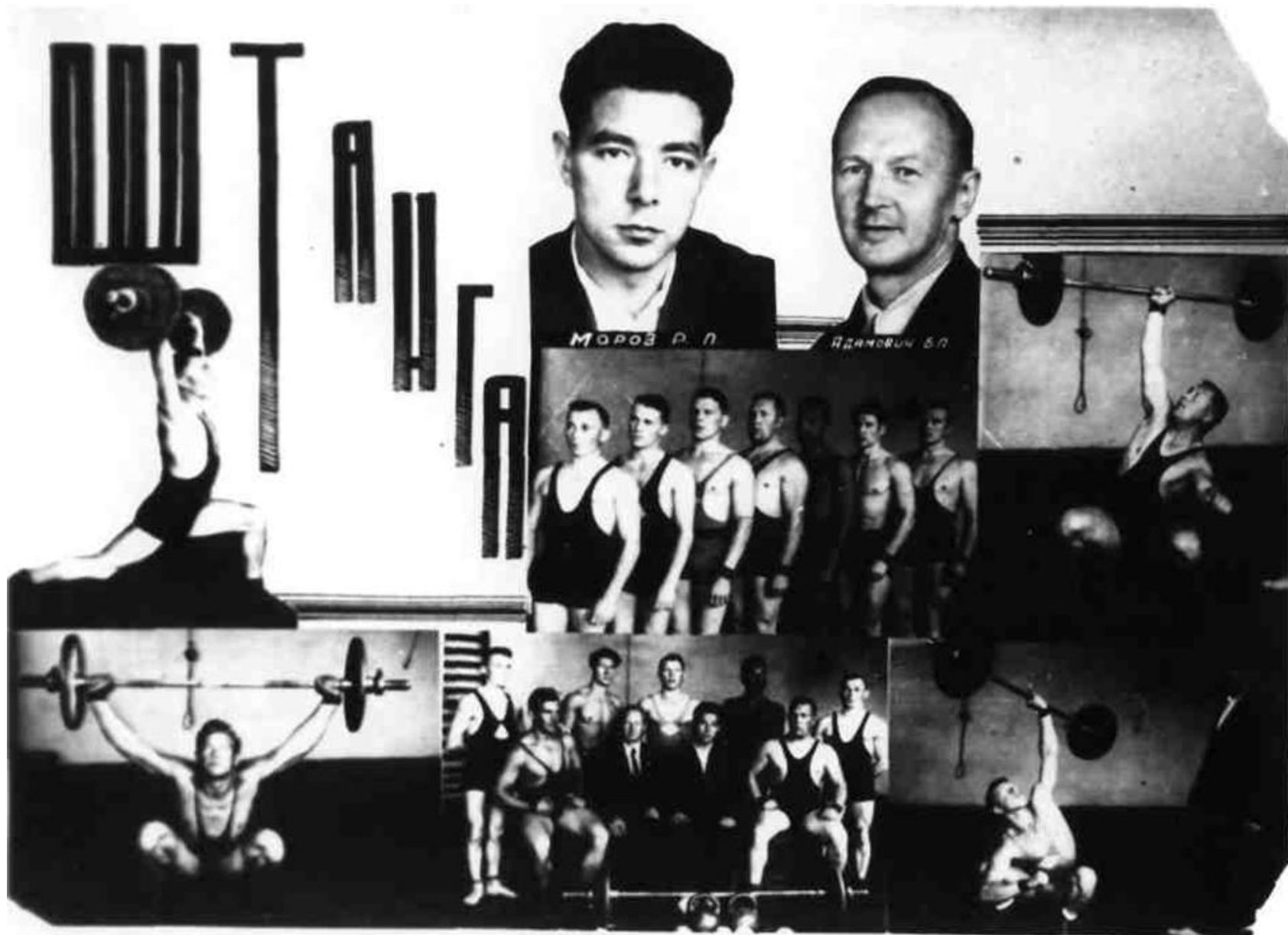
Выпускники кафедры тяжёлой атлетики 1940-1941 учебный год