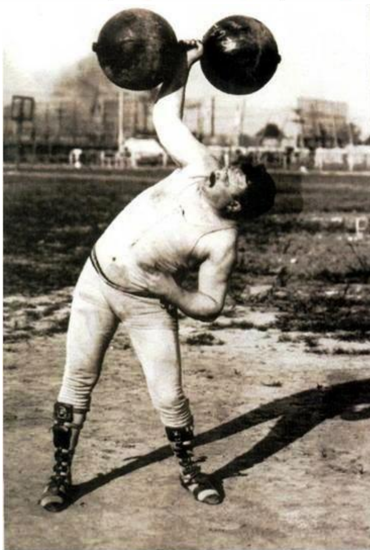
Жим одной рукой.