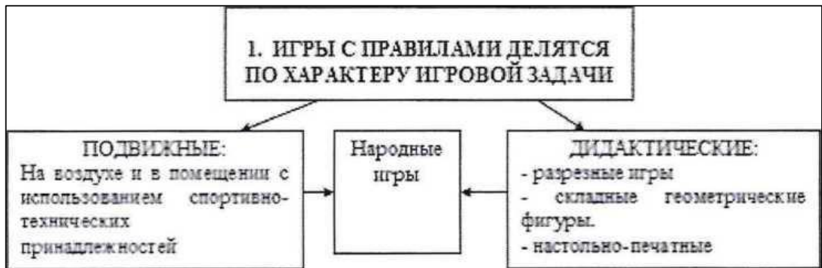
Рисунок 1 - Классификация подвижных игр

Для иллюстрирования структуры явлений или процессов, взаимосвязей элементом системы, иерархии, классификационных признаков и т.п. в работе размещают схемы (рисунок 1).