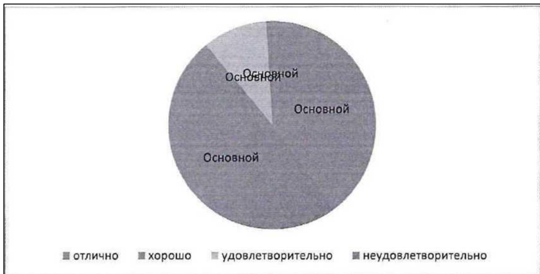
Рисунок 4 - Структура успеваемости школьников по физкультуре