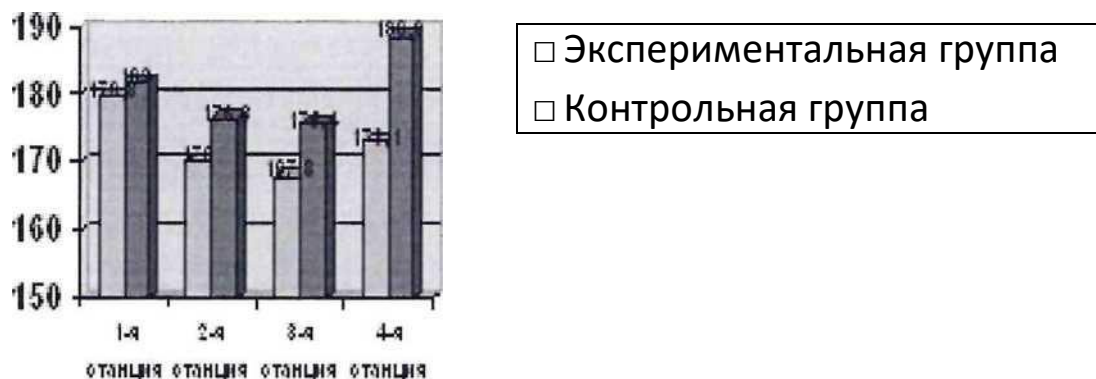
Рисунок 5 - ЧСС спортсменов во время тестирования на функциональную подготовку

Столбиковая диаграмма (рисунок 5): это последовательность столбцов, каждый из которых опирается на один разрядный интервал, а высота его отражает число случаев или частоту в этом разряде. Каждая ось должна быть обозначена.