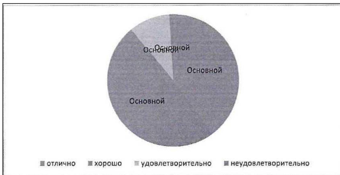
Рисунок 4 - Структура успеваемости школьников по физкультуре