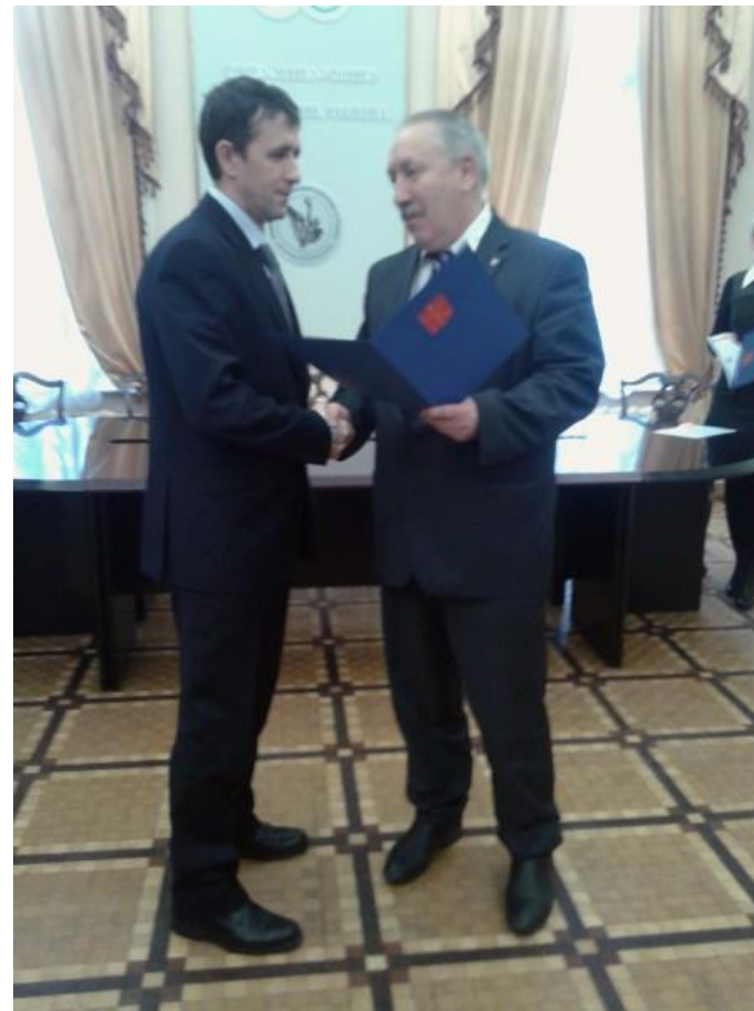
Заслуженный мастер спорта Республики Казахстан (гиревой спорт)