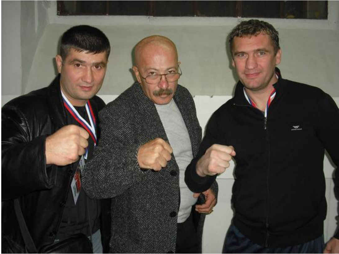
мастер спорта международного класса (бокс)