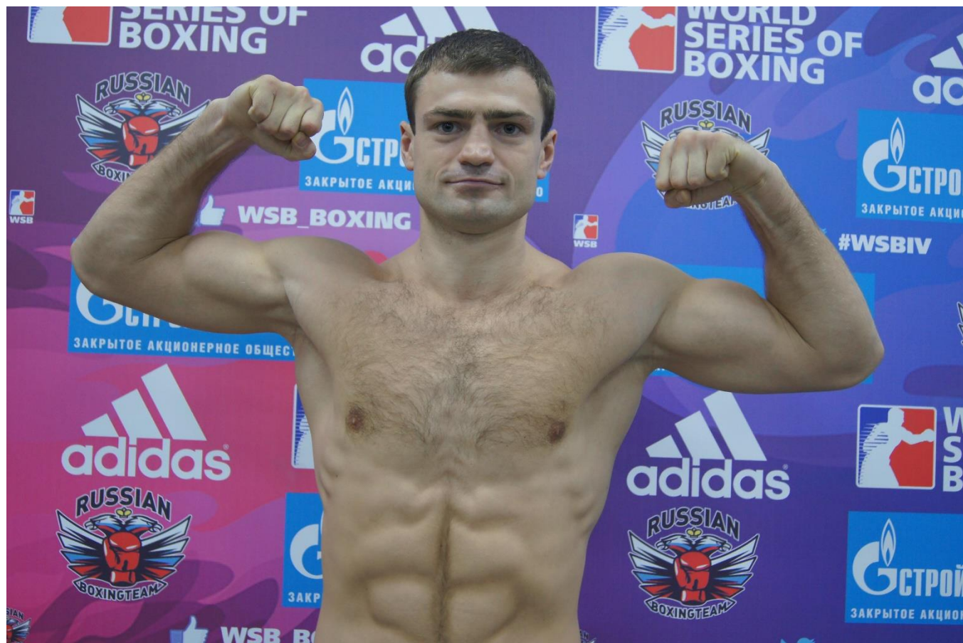
мастер спорта международного класса по боксу