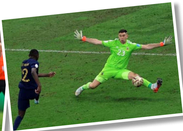
Голкипер аргентинцев Эмилиано Мартинес был признан лучшим вратарем на чемпионате мира.

ставе для команды Скалони сложились неудачно: после ухода Ди Марии игра в атаке у аргентинцев стала менее острой.