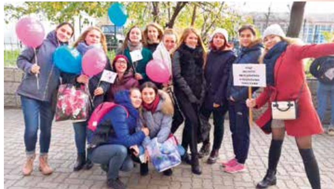
Студенты 3 курса направления «Журналистика», авторы газеты «Спорт-кадры»

– За двадцать лет институт очень вырос. Ведь когда появился факультет экономики, управления и права, на основе которого был создан институт, необходимо было пополнять кадровые резервы, разрабатывать собственные образовательные программы, ремонтировать аудитории и, разумеется, набирать студентов. И если в первый год создания института студентов набирали на направление «Менеджмент», то сейчас выбор профессий стал шире: в сфере туризма, сервиса, международных отношений, журналистики, связей с общественностью и рекламы. Именно эти образовательные направления