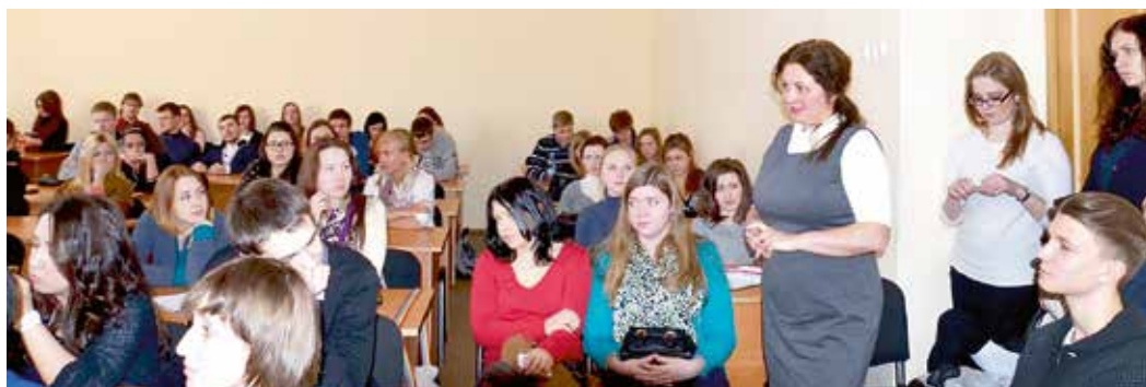
Мастер-классы в институте вызывают большой интерес аудитории

– Развитие международного сотрудничества – одна из наших приоритетных задач. У каждого прилежного студента есть возможность пройти стажировку в течение семестра или получить двойной диплом в Финляндии и Швеции. Мы работаем с финским Университетом прикладных