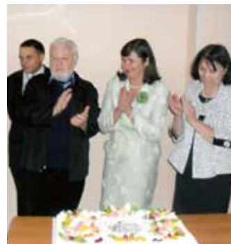
Пятилетие кафедры связей с общественностью

– Да, мы уделяем нетворкингу не меньше внимания, чем семина-