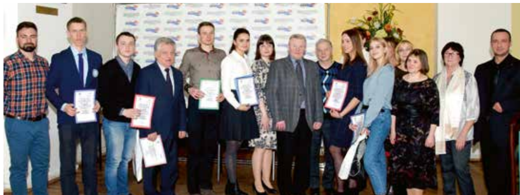
Молодые ученые института получают признание на научных конференциях

– В настоящее время в институте реализуются шесть программ уровня бакалавриата и пять – магистратуры, но рейтинг той или иной программы определяется состоянием рынка труда. В 1999 году мы начали с программы «Менеджмент», на которую тогда был большой спрос. С 2005-го по 2015-й первенство делили программа «Менеджмент», «Связи с общественностью», «Социально-культурный сервис и туризм». Сегодня в лидерах программы «Менеджмент», «Международные отношения» и «Журналистика». В магистратуре одно из наиболее популярных направлений – «Государственное и муниципальное управление» (ГМУ – ред.). На ГМУ поступают обучаться прак-