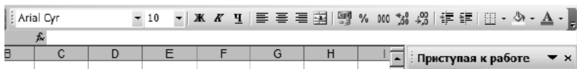
Рис. Поле для ввода формул f(x) табличного процессора Excel

часто выполняется через поле f(x) . При этом происходит помещение функции в «активную клетку».