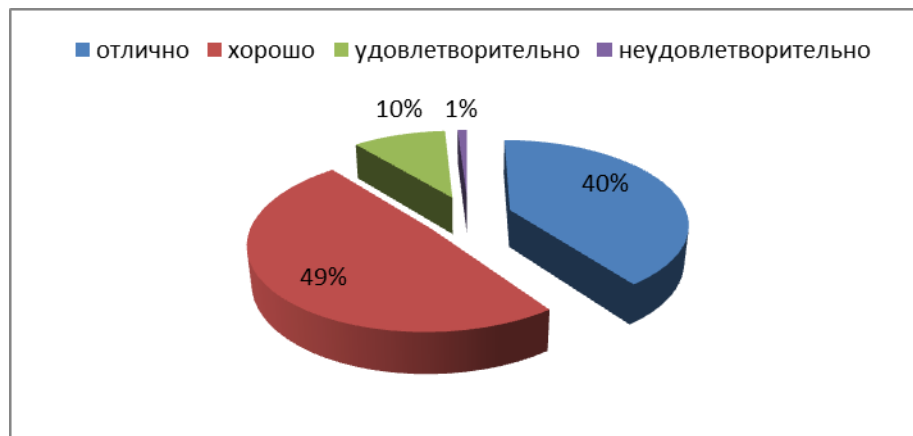
Рисунок 4 - Структура успеваемости школьников по физкультуре