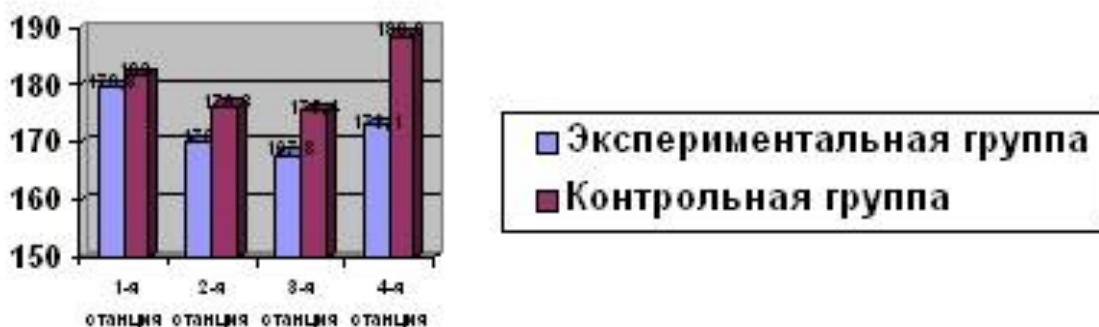
Рисунок 6 - ЧСС спортсменов во время тестирования на функциональную подготовку

Столбиковая диаграмма (рисунок 6): это последовательность столбцов, каждый из которых опирается на один разрядный интервал, а высота его отражает число случаев или частоту в этом разряде. Каждая ось должна быть обозначена.