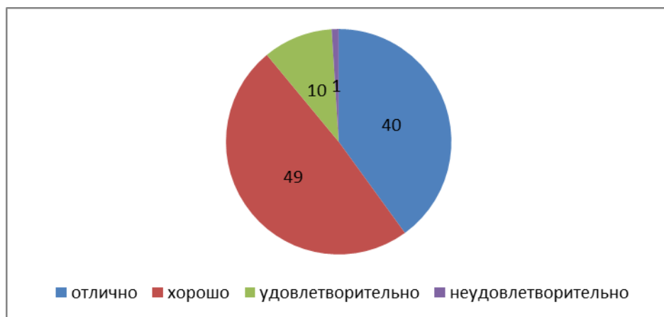
Рисунок 5 - Структура успеваемости школьников по физкультуре

Столбиковая диаграмма (рисунок 6): это последовательность столбцов, каждый из которых опирается на один разрядный интервал, а высота его отражает число случаев или частоту в этом разряде. Каждая ось должна быть обозначена.