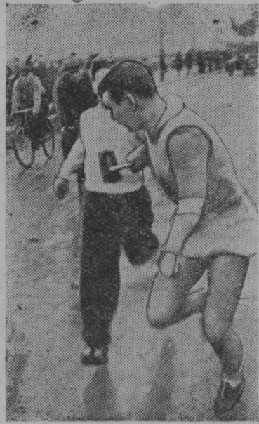
Момент передачи эстафеты.

Традиционной первомайской эстафетой фактически открылся легкоатлетический сезон. Эстафета закончилась убедительной победой нашей первой команды, покрывшей дистанцию за 32 мин. 16 сек. Второе место заняла команда «Динамо», третье — вторая команда института, опередившая ЛВО, «Спартак» и др. Чем объяснить преимущество наших команд? Своевременной умелой подготовкой. Вся команда провела длительную тренировку в Кавголово. В других же коллективах лучшие мастера тренируются на юге, а остальные упражняются тогда и где попало. Я говорю — упражняются, потому что под тренировкой надо понимать не только физическую работу за городом или на стадионе, а гораздо шире: выполнение режима сна, питания, чередование работы, отдыха и т. д. Наши команды так и строили свою тренировку. В командных соревнованиях отдельные сильные спортсмены, как правило, не решают исхода борьбы. Победа достается команде, равной по своему составу, спаянной, организованной, дружной, где каждый уверен в себе и в своих товарищах. Вот такими были наши команды. Необходимо отметить, что в первой команде было 6 чел., впервые принимавших участие в таких ответственных соревнованиях. Со своей задачей они справились успешно. Легкоатлеты в настоящее время представляют собой дружный коллектив, который ежедневно проводит зарядку, регулярно тренируется на стадионе. Студенты I курса уже сейчас поняли, что только систематическая тренировка приведет к