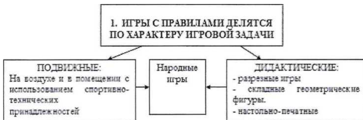
Рисунок 1 - Классификация подвижных игр

Для иллюстрирования структуры явлений или процессов, взаимосвязей элементов системы, иерархии, классификационных признаков и т.п. в работе размещают схемы (рисунок 1).