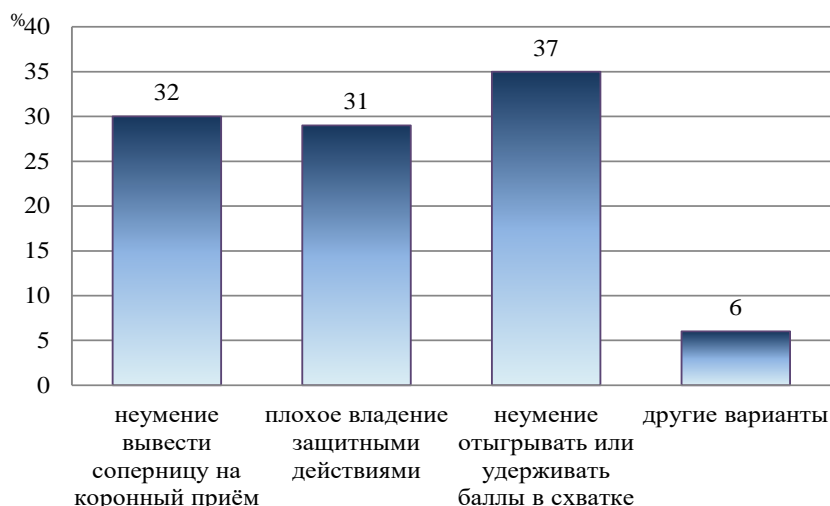
Рисунок 2 - Основные недостатки технико-тактической подготовки девушек-борцов 15-16 лет в настоящее время

Столбиковая диаграмма (рисунок 2): это последовательность столбцов, каждый из которых опирается на один разрядный интервал, а высота его отражает число случаев или частоту в этом разряде. Каждая ось должна быть обозначена.