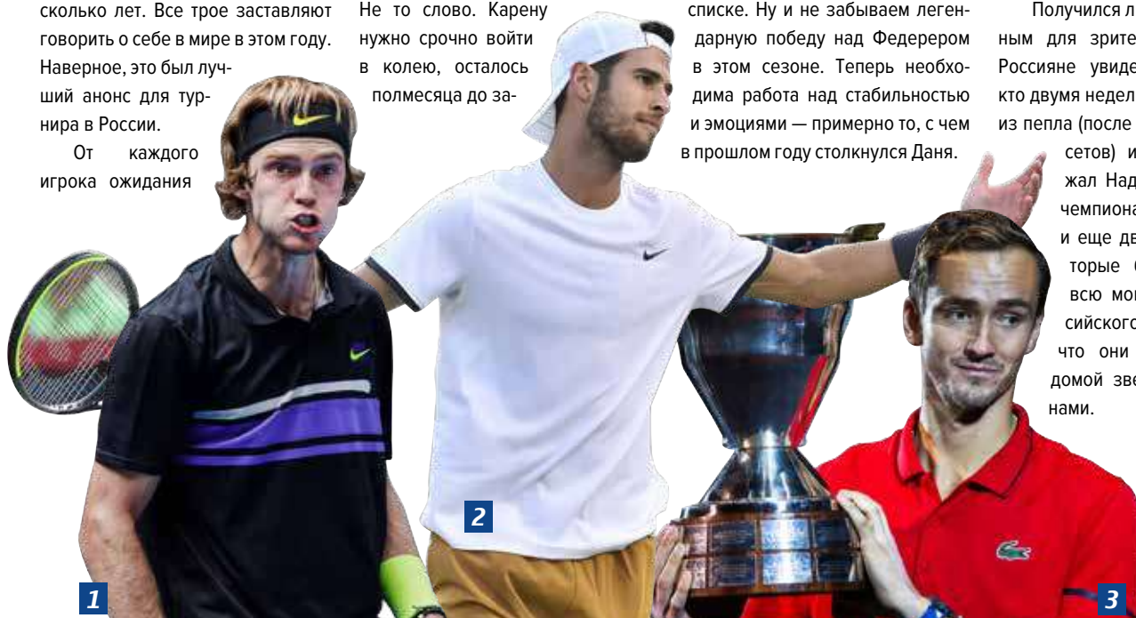
Фото: 1 — Андрей Рублев. Getty Images/VCG/VCG; 2 — Карен Хачанов. Getty Images/Minas Panagiotakis; 3 — Даниил Медведев. Getty Images/Игорь Русаков

Получился ли этот турнир удачным для зрителей? Безусловно. Россияне увидели триумф того, кто двумя неделями ранее восстал из пепла (после двух проигранных сетов) и практически дождал Надаля. Они увидели чемпиона, а вместе с ним и еще двух богатырей, которые будут показывать всю мощь мужского российского тенниса. Главное, что они будут приезжать домой звездами и чемпионами.