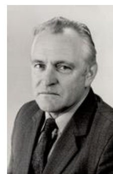
Никита Мстиславович Моисеев