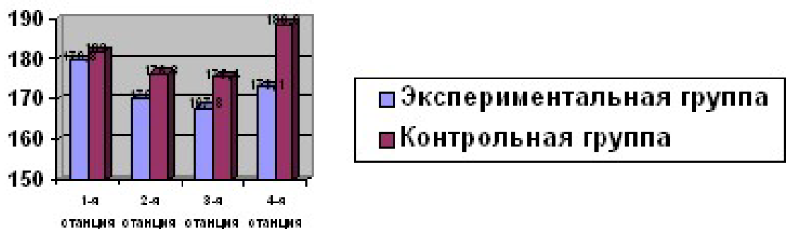
Рисунок 5 - ЧСС спортсменов во время тестирования на функциональную подготовку

Столбиковая диаграмма (см. рисунок 5): это последовательность столбцов, каждый из которых опирается на один разрядный интервал, а высота его отражает число случаев или частоту в этом разряде. Каждая ось должна быть обозначена.