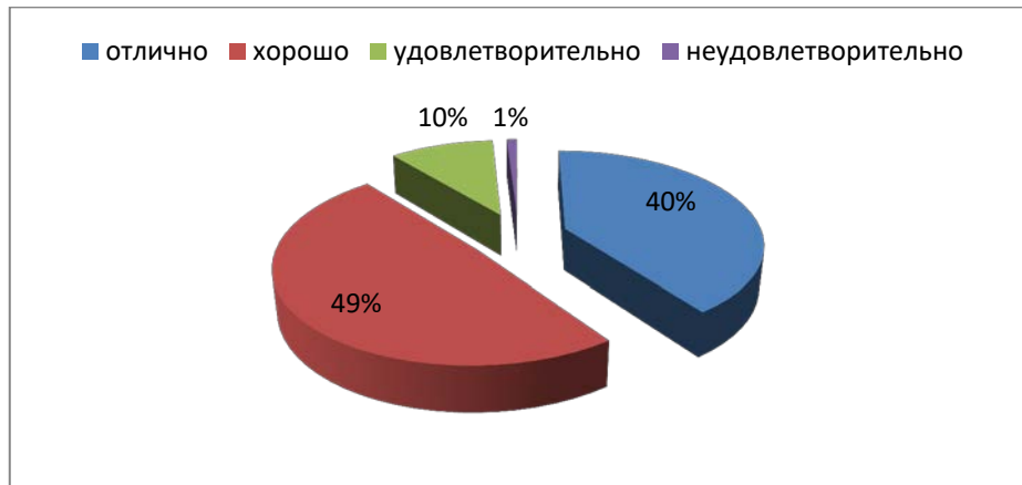
Рисунок 3 - Структура успеваемости школьников по физкультуре