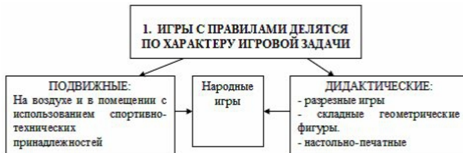
Рисунок 1 - Классификация подвижных игр

Для иллюстрирования структуры явлений или процессов, взаимосвязей элементом системы, иерархии, классификационных признаков и т.п. в работе размещают схемы (см. рисунок 1).