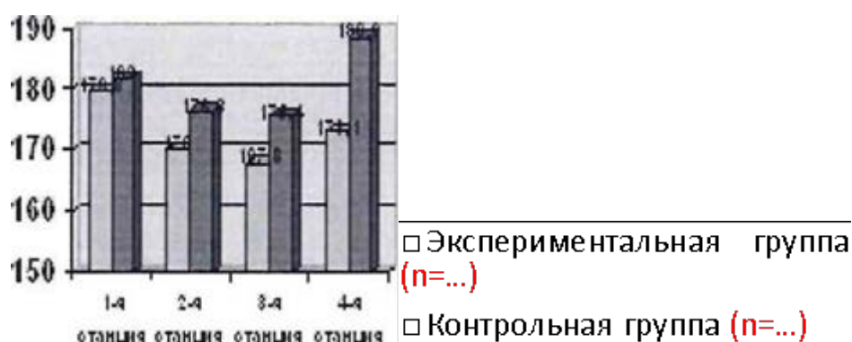
Рисунок 5 - ЧСС спортсменов во время тестирования на функциональную подготовку, уд/мин

Столбиковая диаграмма (рисунок 5): это последовательность столбцов, каждый из которых опирается на один разрядный интервал, а высота его отражает число случаев или частоту в этом разряде. Каждая ось должна быть обозначена.