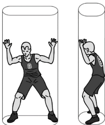
Рисунок 1 – Принцип _____? (цилиндра)

15. Какой принцип, используемый в баскетболе 3х3 представлен на рисунке 1?